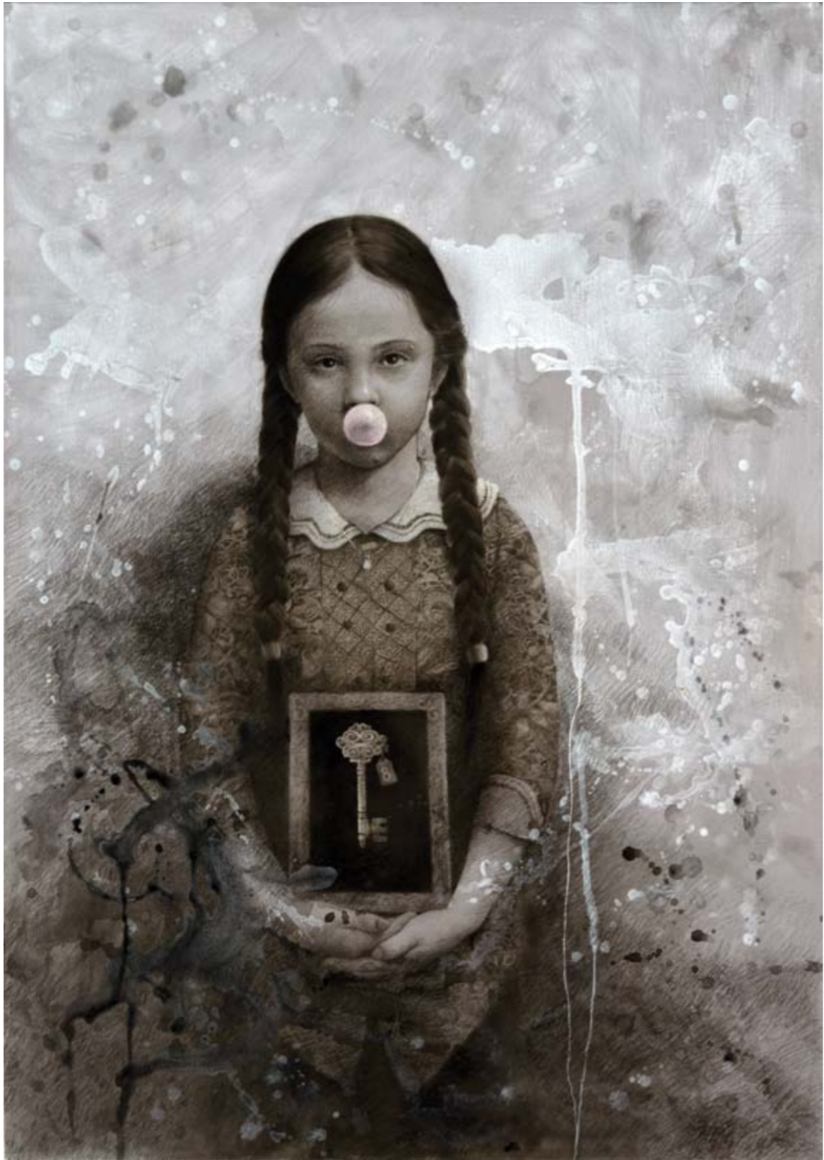
Seno Andrianto Next Step

charcoal, acrylic and pastel on canvas 170 x 120 cm, 2018