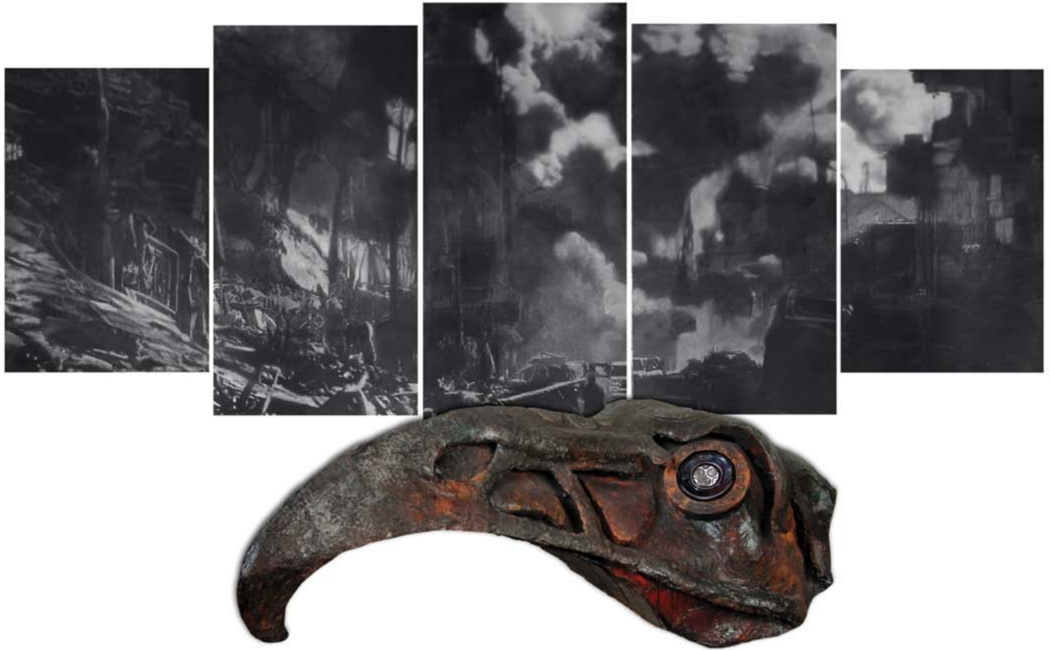
Putut Wahyu Widodo IN THE NAME... (Homage to The Plague Doctor) duplex, resin, enamel; charcoal and acrylic on duplex 110 x 65 x 45 cm; 40 x 86 cm (1), 40 x 77,5 cm (2), 40 x 28,5 cm (2), 2018