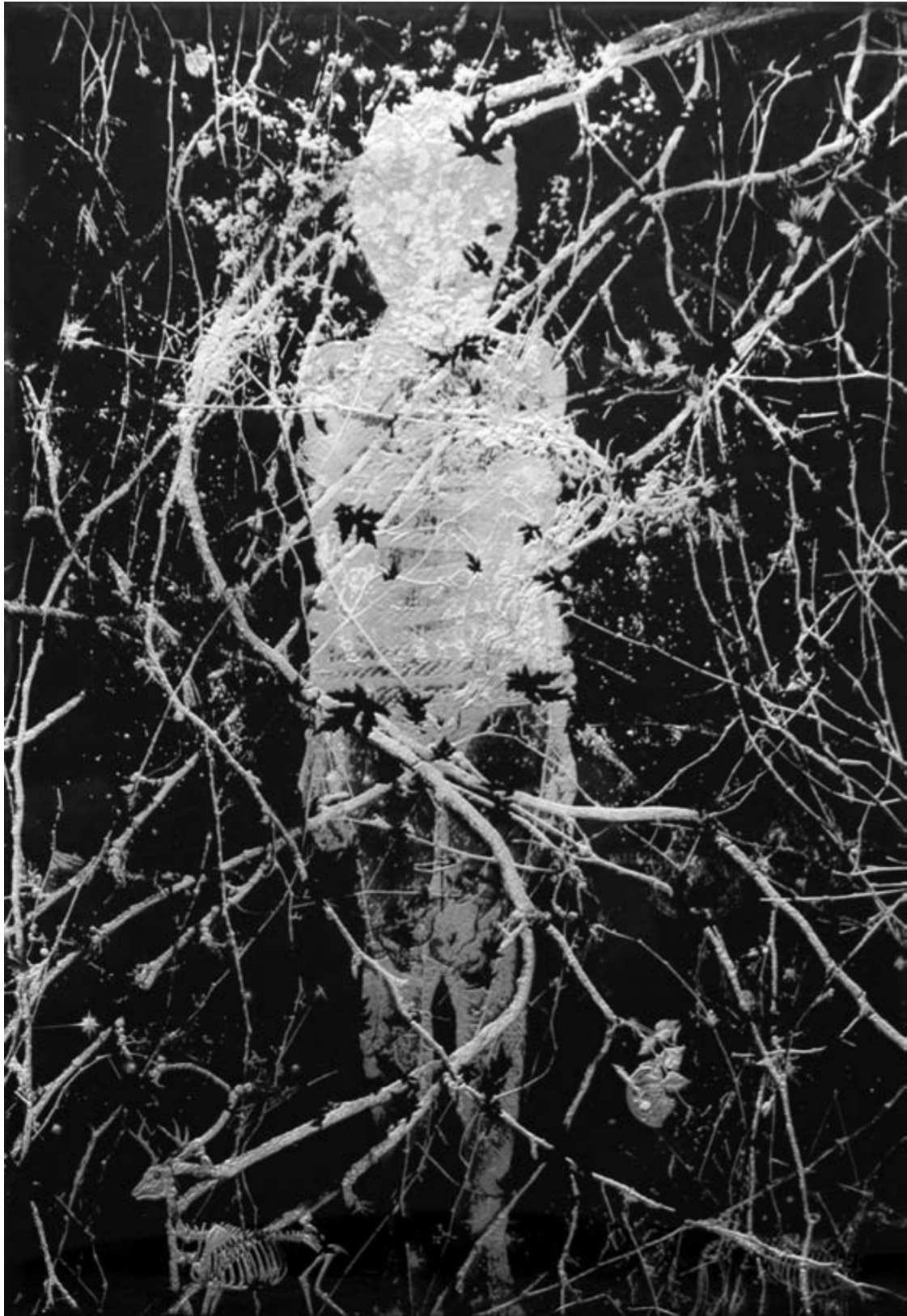
Bestrizal Besta Tanpa Batas #2 engrave on acrylic LED 135 x 90 cm, 2018