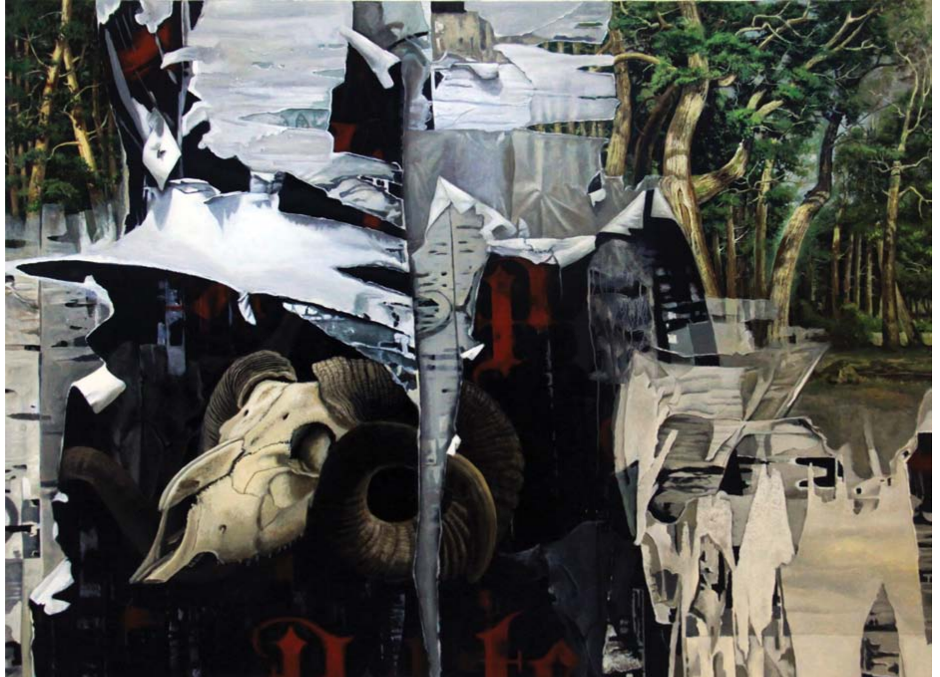
Isa Ansory Jejak Jejak Hijau acrylic on canvas 150 x 200 cm, 2018