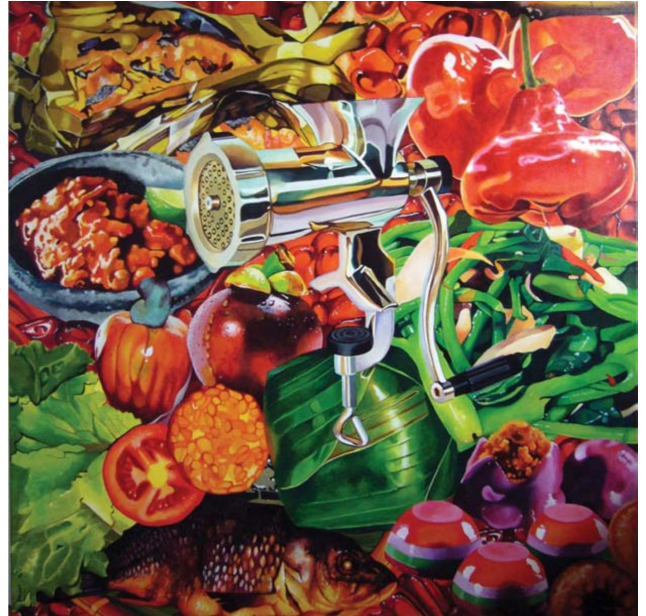
Nurhidayat Utopie acrylique sur toile 150 x 150 cm, 2011