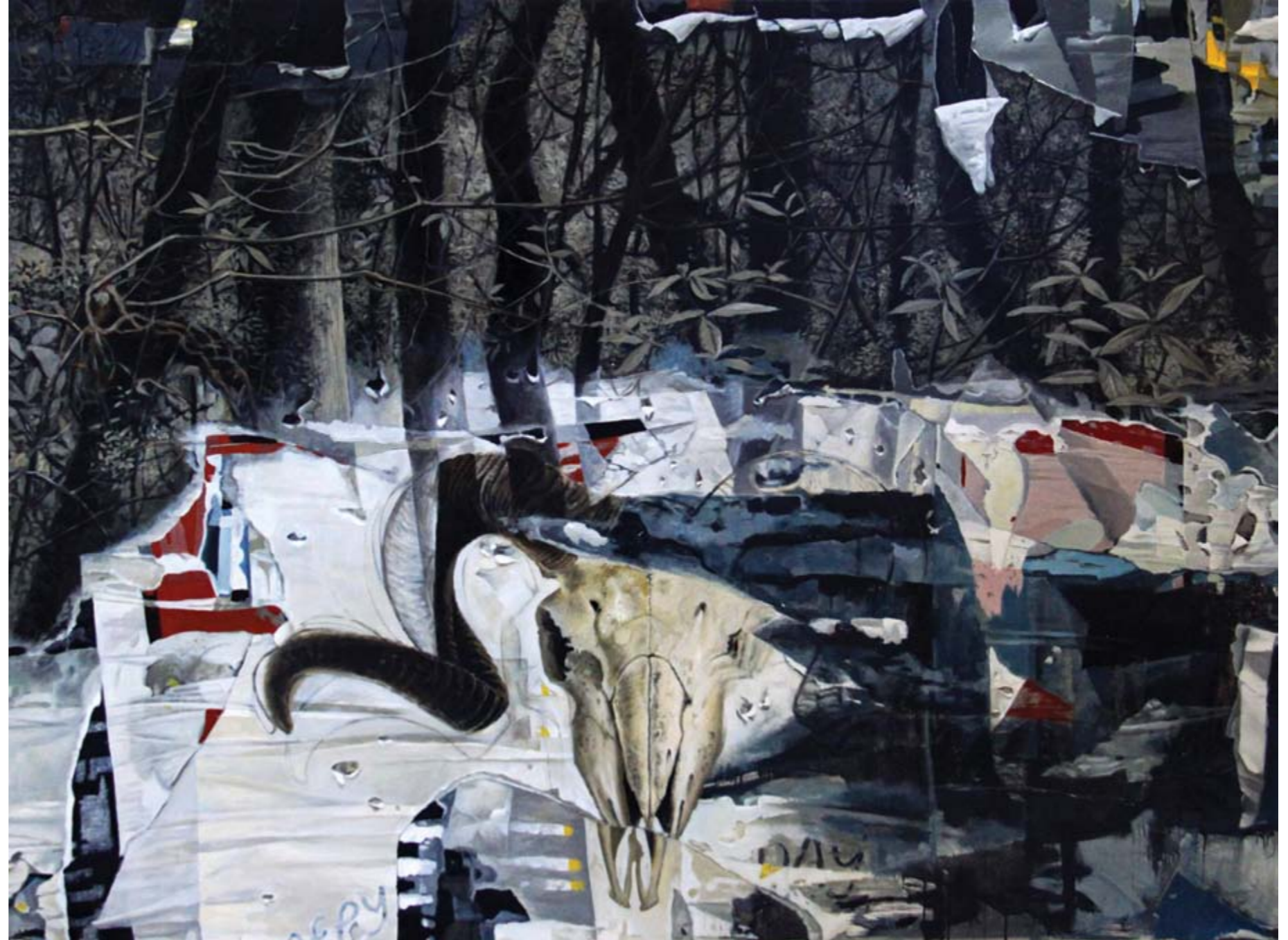
Isa Ansory Sajak Malam Para Gembala #2 acrylic on canvas 150 x 200 cm, 2018