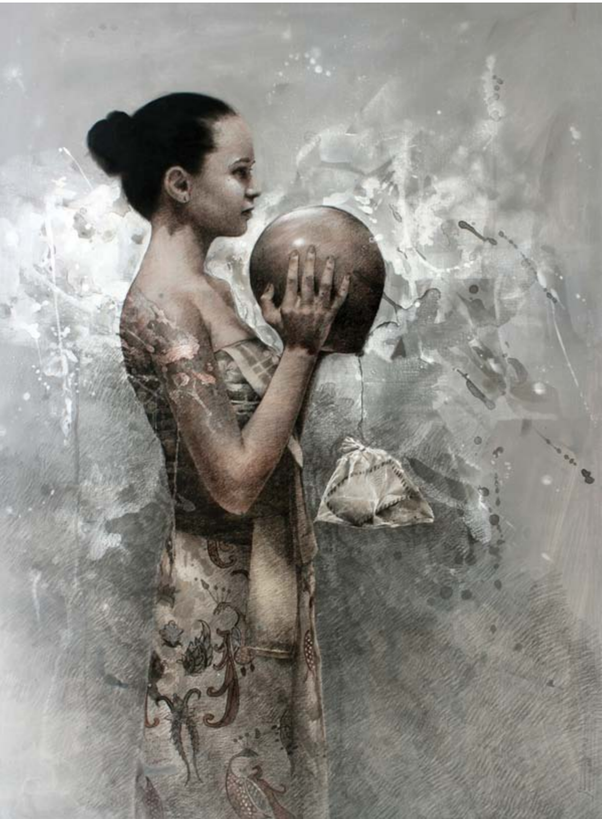
Seno Andrianto Series of Letters #5 charcoal, pastel and acrylic on canvas 150 x 110 cm, 2018