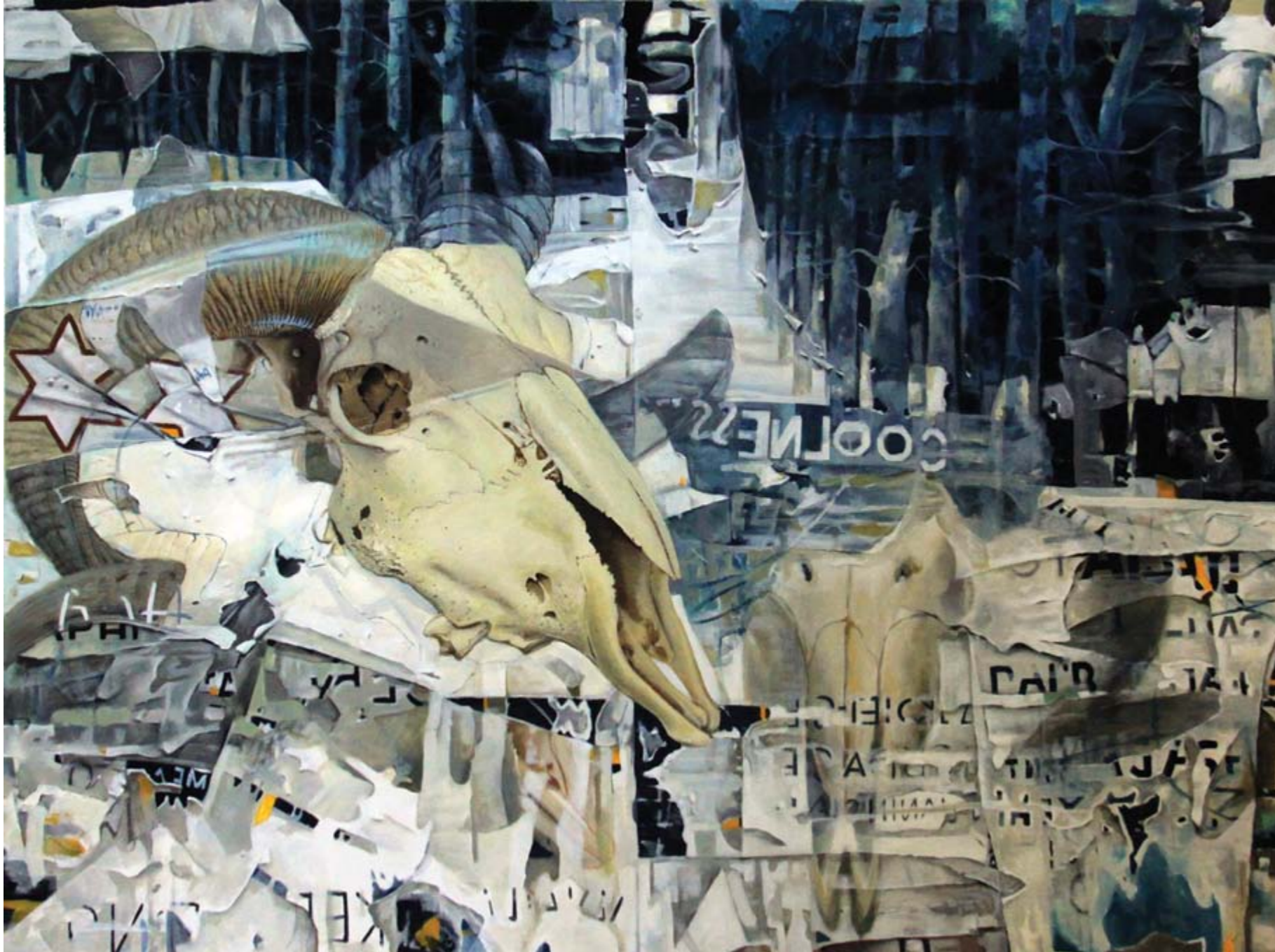
Isa Ansory Sajak Malam Para Gembala #1 acrylic on canvas 150 x 200 cm, 2018