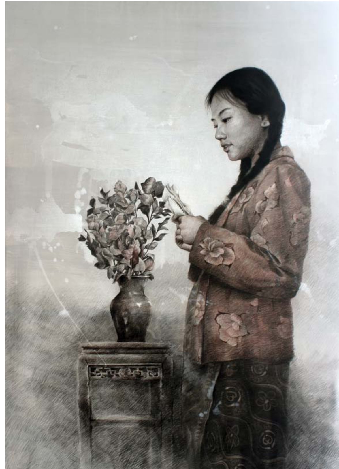
Seno Andrianto Series of Letters #4 charcoal, pastel and acrylic on canvas 170 x 120 cm, 2018