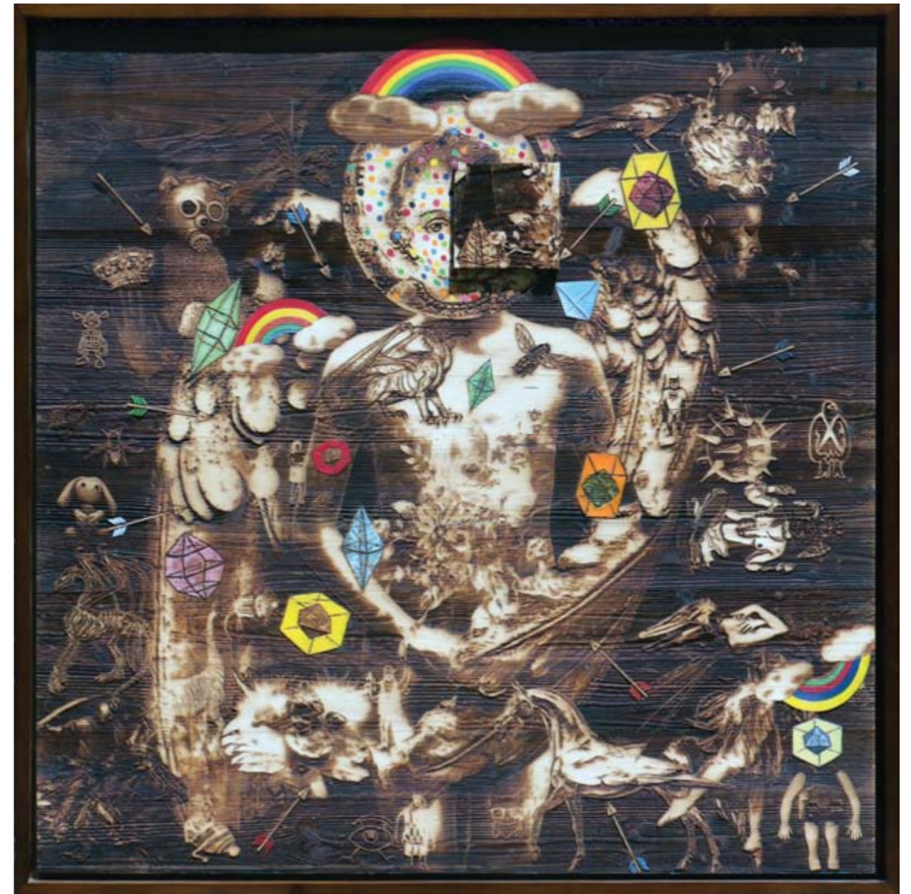
Bestrizal Besta I See The Rainbow In The Sky engrave on wood 120 x 120 cm, 2018