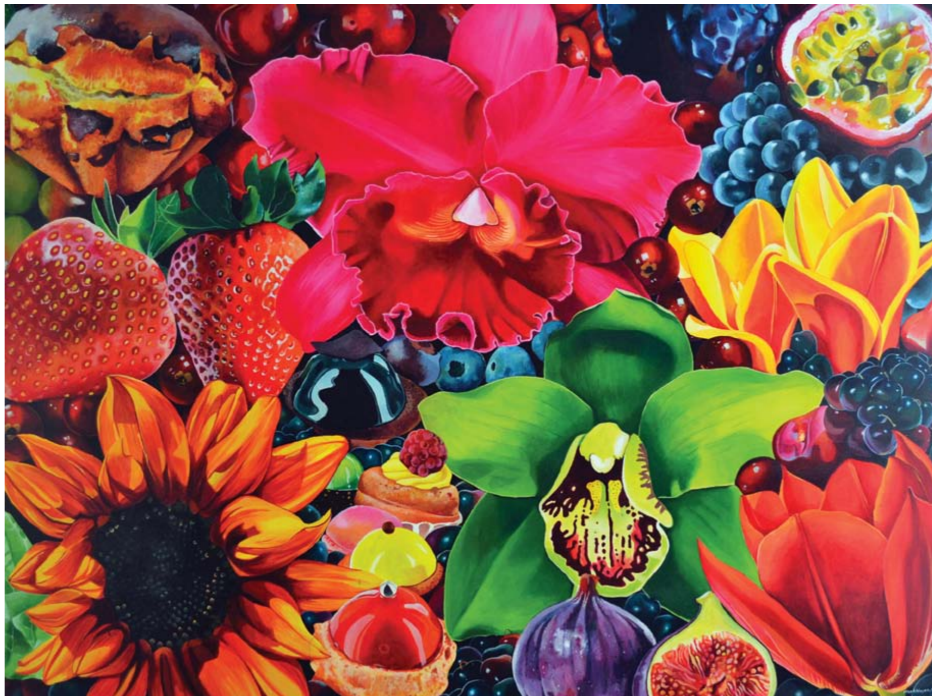
Nurhidayat Erotique, Toxique, Exotique acrylique sur toile 120 x 160 cm, 2011