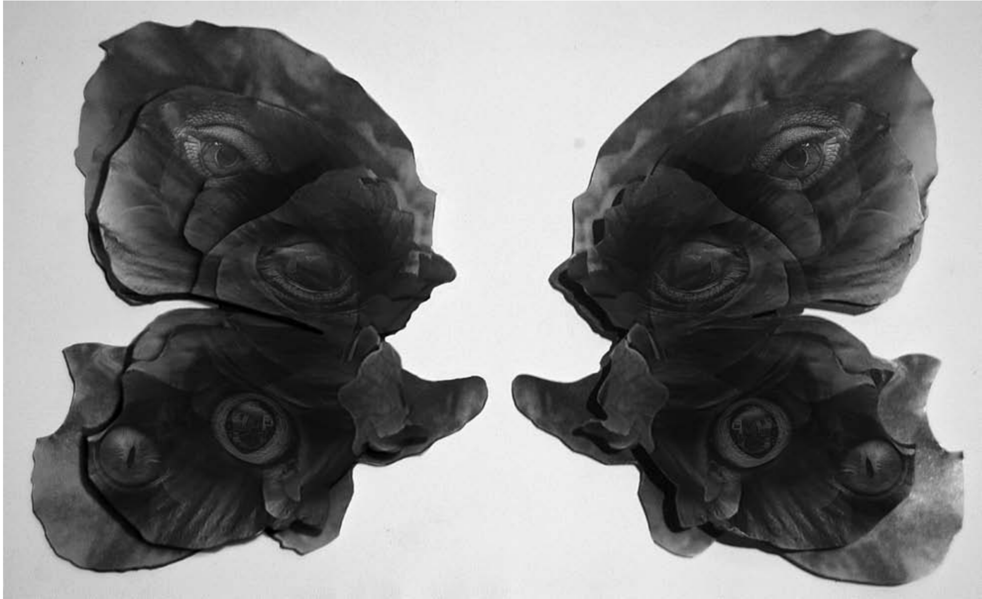
Putut Wahyu Widodo WHERE IS WHERE IS THE ANGEL? (Homage to Danarto) charcoal and acrylic on duplex 216 x 176 cm (2), 2018