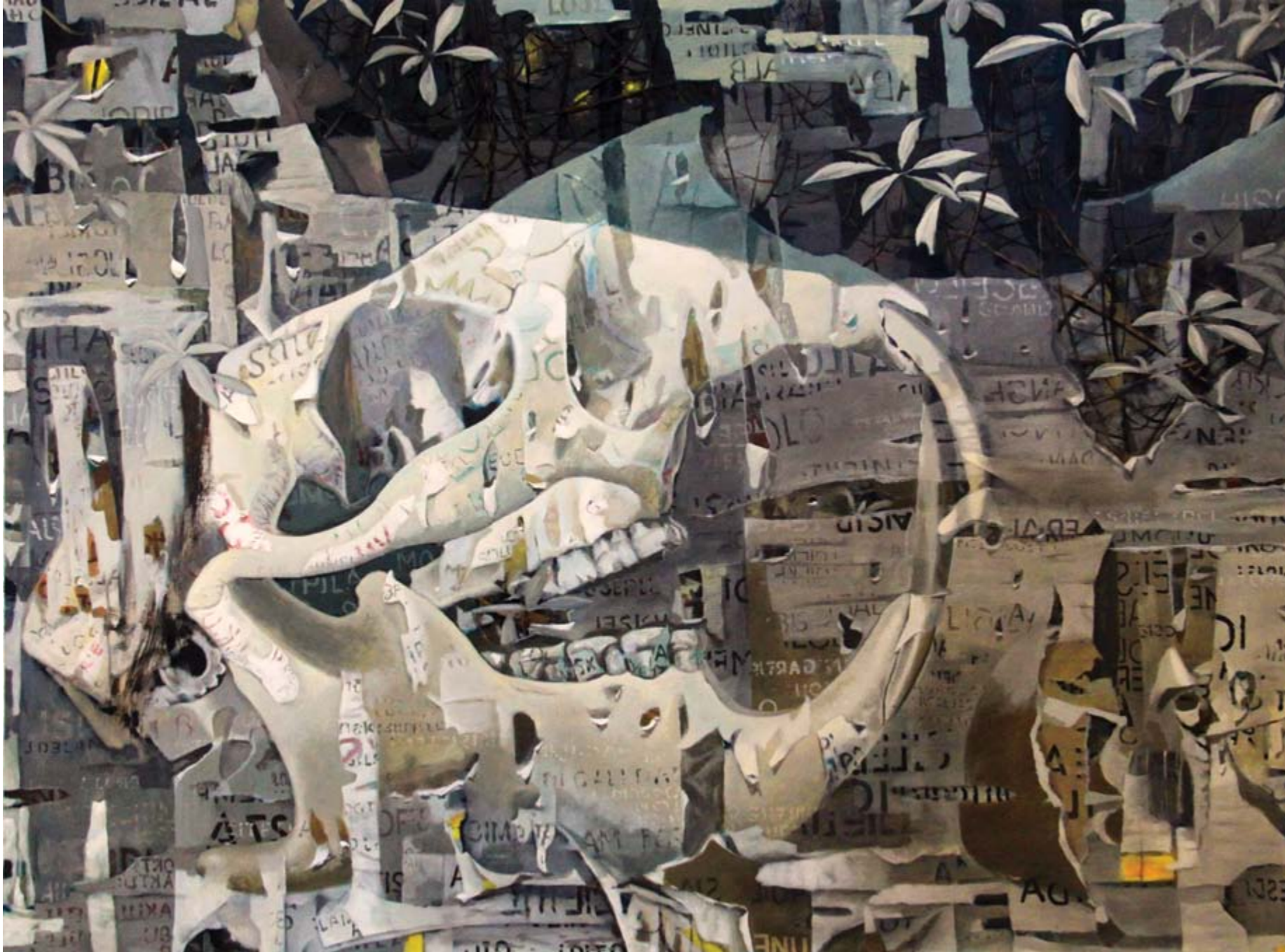
Isa Ansory Sajak Malam Para Gembala #3 acrylic on canvas 150 x 200 cm, 2018