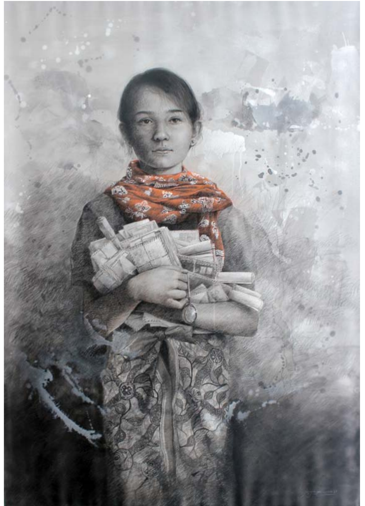
Seno Andrianto Series of Letters #3 charcoal, pastel and acrylic on canvas 170 x 120 cm, 2018