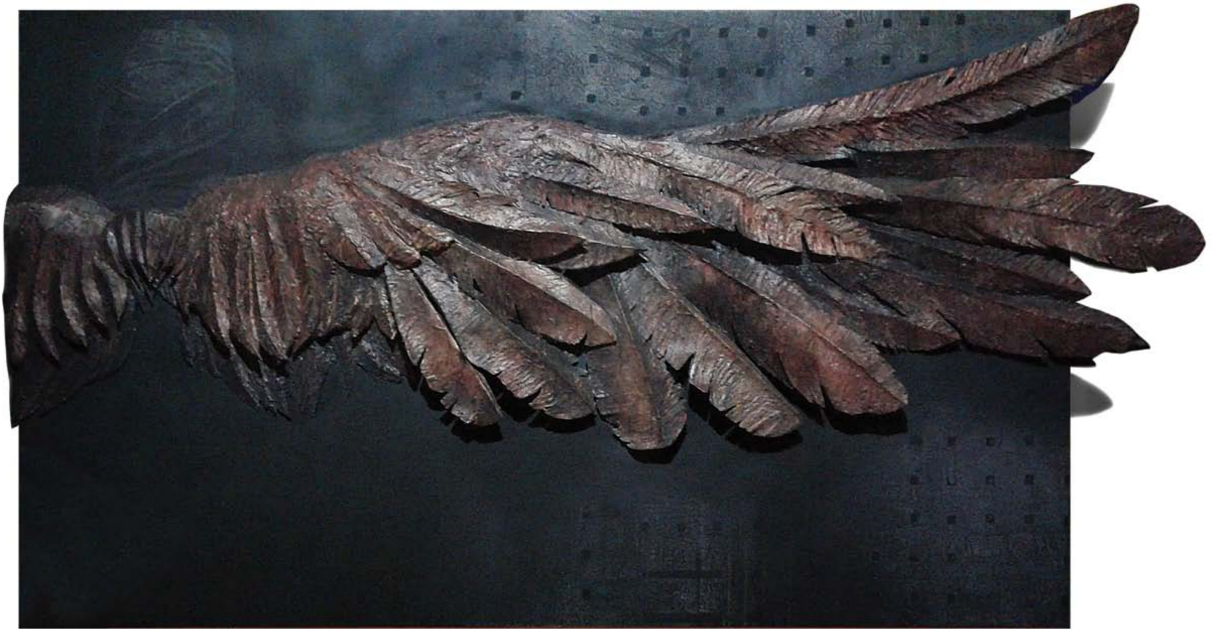
Putut Wahyu Widodo FINAL JOURNEY TO SIMURGH (Homage to Attar) duplex, resin, enamel, charcoal, acrylic 110 x 220 x 10 cm, 2018